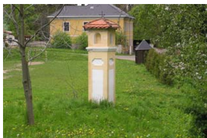
Kaplička u dolejšího rybníka