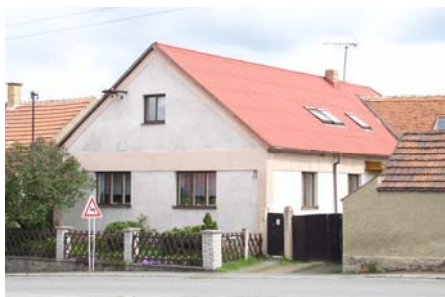
Hospoda U Petáků