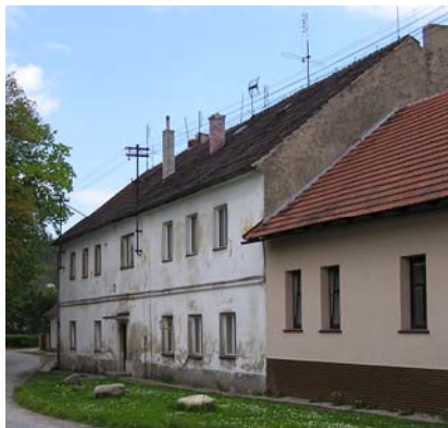
Hospoda v domě č.p.23

V Hluboši se pěstovalo i mnoho ovocných stromů. Zdá se až neuvěřitelné, že v roce 1935 bylo napočítáno 2.458 kusů jabloní, 695 hrušní, 554 třešní, 381 višní, 1.595 švestek a 64 ořešáků. A k těmto statistickým údajům přidám i několik čísel o živnostech v Hluboši v první polovině XX.století. Hlubošské občany zásobovali čtyři obchody se smíšeným zbožím, dva řezníci, dva pekaři, jeden trafikant a jedna prodejna obuvi. Dále zde pracovali další drobní řemeslníci jako kováři, krejčí, ševci, truhláři, malíři pokojů atd.