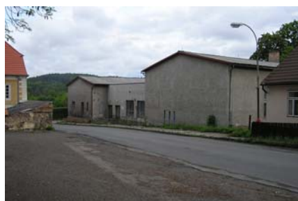
Hospoda Na Knížecí