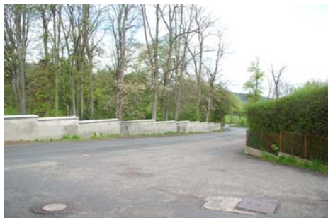
Zde stál pivovar

Šobíškům, kteří zde zřídili hospodu a řeznictví. Do této kapitoly patří asi také zmínka o hlubošském pivovaru. Již Leopold Račín uvádí ve svém