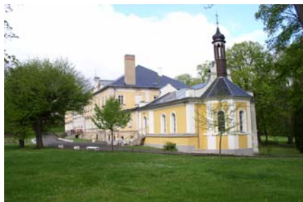
Kaple Svatého Kříže