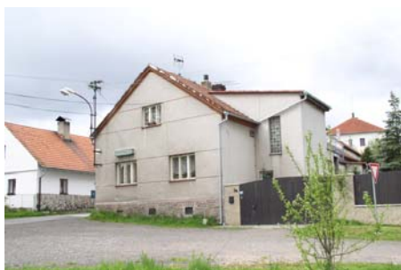
Hospoda U Fialů