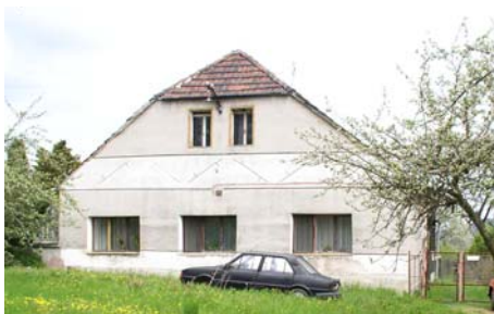
Hospoda U Kalinů

Hospoda Na Knížecí vznikla v roce 1876 po zbouraném a přestěhovaném statku č.4. Byla majetkem panským a byla pronajímána. Největšího věhlasu získala po roce 1929, kdy byl přistavěn velký sál. Zanikla na konci XX.století.