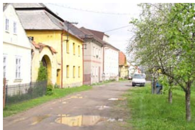
První tři školy

děti ). Byl to vyhlášený hudebník, který hrál také na již zmiňovaném hracím stroji v zámku. Místo, kde se začalo vyučovat, není zaznamenáno. Lze usuzovat, že to bylo v bytě učitele, to znamená v domě č. 38 ( po zavedení matrik v roce 1788 jsou v tomto domě vedeny narozené děti tohoto učitele ). Od roku 1788 se vyučovalo v domě č.54, poté asi dva roky v „Půrku“. V dnešní faře č.p. 37 se učilo do roku 1810. Pak se škola vrátila opět do č. 38, kde se učilo 48 let a je to vlastně první školní budova ( tento dům později vyhořel a byl znovu postaven v roce 1899 ). Od roku 1859 se učilo ve vedlejší budově č.p. 55 a to až do doby vybudování nové školy. Ta byla postavena mimo obec v roce 1913 a její stavba stála 94.000Kč. Při větším počtu dětí byly jednotlivé třídy umístěny i v rodinných domcích např. na „Lipce“ č.p.36 nebo v č. 106 u Schořovských. Nová škola měla šest tříd a chodily do ní děti z Hluboše, Bratkovic, Dominikálních Pasek, Sádku a Kardavce. Děti z Drahlína a Sádku přestaly do Hluboše docházet v roce 1871, kdy byla v Drahlíně zřízena škola.